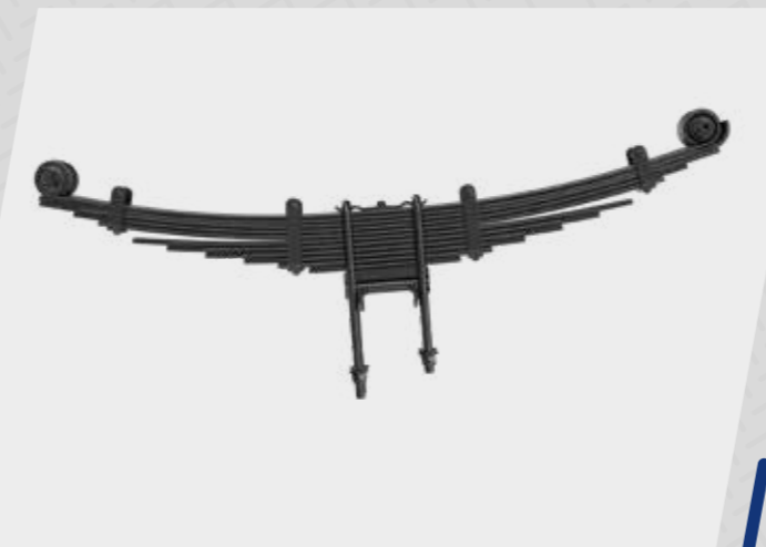
Suspension sans graisse