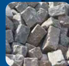
Concasseur de pierre