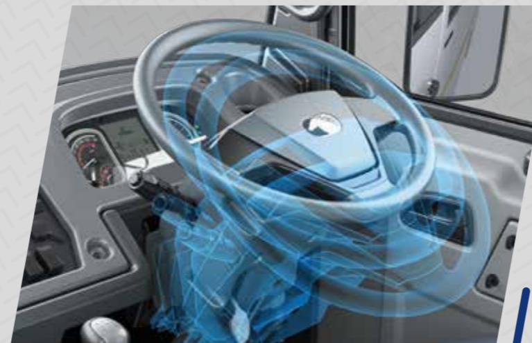
Direction assistée inclinable et télescopique