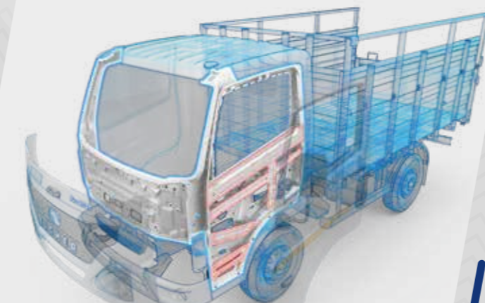
Cabine à double panneau