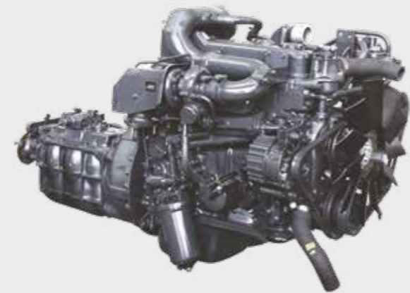
Moteur Eicher E483 éprouvé

Nous vous présentons le Pro 2080T avec le moteur E483 doté d'une puissance de 115 CV avec un couple de 400 Nm et une capacité d'adaptation qui répond aux attentes du marché. Avec une nouvelle génération de caractéristiques de cabine promettant une sécurité élevée et un confort exemplaire, le Pro 2080T est un choix parfait pour toutes les applications de bennes d'une capacité de 4,5 m 3 .