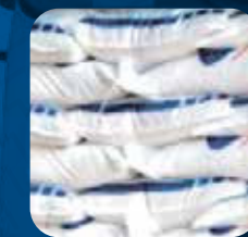
Chargement du marché