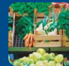
Fruits et légumes