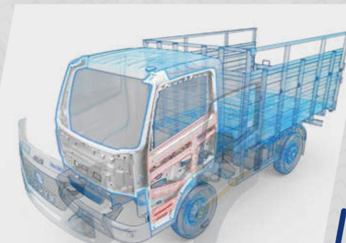
Cabine à double panneau