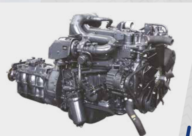
Moteur Eicher E483 éprouvé

L'Eicher Pro 2095 offre le meilleur kilométrage de sa catégorie et un confort de conduite révolutionnaire. Sa technologie nouvelle génération est en avance sur la courbe pour les années à venir. Le Pro 2095 vous promet une entreprise rentable.