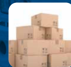
Colis et courrier