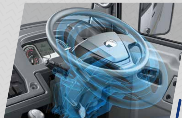
Direction assistée inclinable et télescopique